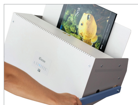
Einfach zu bedienen