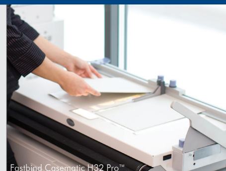
Fastbind Casematic H32 Pro™

Sobald der Umschlag hergestellt ist, können Sie das Buch mit einer Fastbind Bindemaschine fertigstellen. Fastbind stellt alle notwendigen Materialien und Hilfsmittel zur Verfügung, um Hardcover für die Print-on-Demand-Umgebung herzustellen.