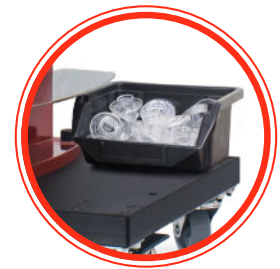
Behälter zur Aufbewahrung von Ösen