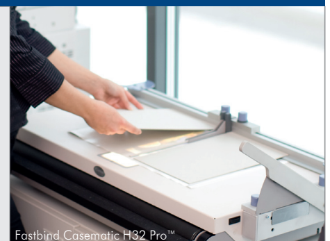
Fastbind Casematic H32 Pro™

Sobald der Umschlag hergestellt ist, können Sie das Buch mit einer Fastbind Bindemaschine fertigen. Fastbind stellt alle notwendigen Materialien und Hilfsmittel zur Verfügung, um Hardcover für die Print-on-Demand-Umgebung herzustellen.