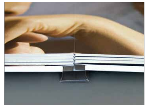
Das fertige Buch lässt sich plan liegend auf 180° öffnen.

Inklusive Cover Guide, Vorratsregal und zwei Cover-Positionierungshaltern.