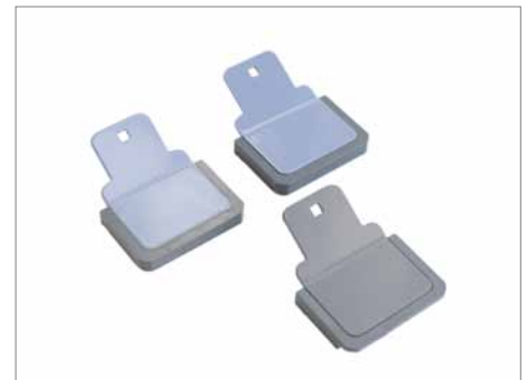
Umschlaghalter und Buchblockhalter (Magnethalter) beiliegend.

Fastbind FotoMount F46e™ ist eine hervorragende Lösung und wurde auf die Anforderungen von professionellen Fotografen, Fotostudios und Laboren entwickelt. Genauso erfüllt die Maschine aber auch die Anforderungen von Digitaldruckereien, Reprografien und Dienstleistern um deren Kunden Premium-Fotoalben anzubieten.