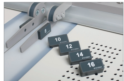
optionales Spacer Set