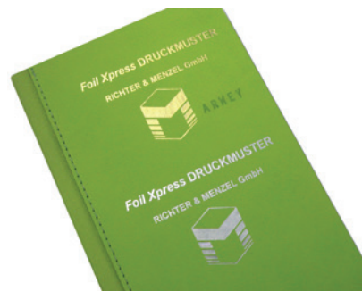
Notizbuch mit Lederoberfläche