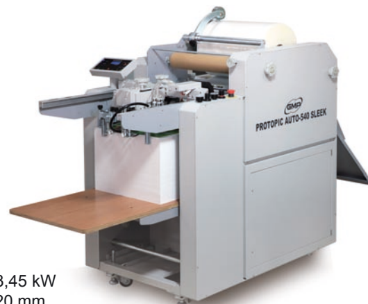
PROTOPIC AUTO 540

PROTOPIC AUTO 540 Sleek Art.-Nr. 03030560 mit Sleeking Option