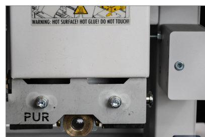
Geschlossener PUR-Leimtank mit Leimapplikator

Dank seines ausgeklügelten Systems lässt sich der Tank auch von nicht fachkundigen Benutzern einfach und schnell reinigen oder austauschen. Mit seiner Reinigungseinstellung benötigt Pureva Smart nur wenige Minuten, um seinen PUR-Leimtank zu entleeren und zu reinigen.