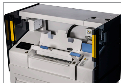
Ein ergonomischer, Stand-Alone PUR/EVA-Klebebinder

Fastbind Pureva Smart ist ein Klebebinder, der sowohl Soft- als auch Hardcover Bücher bis zu A3 Hochformat binden kann. Dank seiner elektronischen Temperaturkontrolle kann er verschiedene Arten von Buchbinde-Schmelzklebstoffen verwenden, insbesondere PUR- und EVA-Klebstoffe. Fastbind gewährleistet die bestmögliche Bindequalität in ihrem Sortiment mit EVA-Klebstoff. Darüber hinaus garantiert der PUR Leim eine außergewöhnliche Bindungsfestigkeit Ihrer Werke.