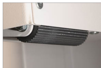
Verbesserte PGO (Paper Grain Opening) Mikroschnitt-Rückenaufrauung

Der Bindeprozess wird durch einen geschickten Einsatz von Automatisierung weiter erleichtert. Der Bediener kontrolliert alle kritischen Schritte, um ein qualitativ hochwertiges Buch herzustellen. Die Funktionen Aufrauen, Leimen und Kleben sind automatisiert und sorgen für Präzision, Beständigkeit, Einfachheit und Benutzerkomfort. Pureva Smart berechnet automatisch den optimalen Druck, die Geschwindigkeit und die Anzahl der Zyklen für die Aufrau- und Klebeschritte sowie die Anpresszeit für jedes Buch je nach Format, Dicke und Einbandart.