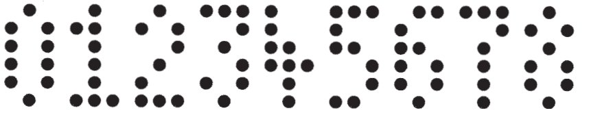
20 mm eng, 3 x 6 Punkte, Ø Nadel 2,3 mm