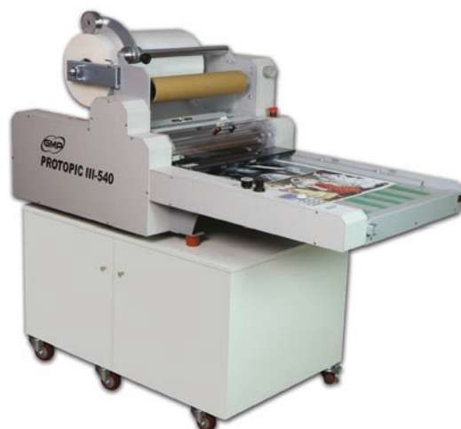
PROTOPIC III 540